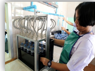
ภาพ กระบวนการผลิตน้ำดื่มโรงเรียนวัดท่าไทร

๓. นักเรียนนำความรู้และทักษะที่ได้รับจากการเรียนรู้ นำไปสร้างรายได้ระหว่างเรียน คือ