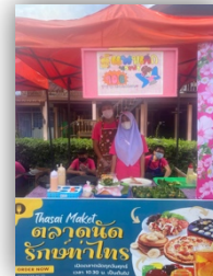
ภาพ การจัดกิจกรรมตลาดนัดรักษ์ท่าไทร ทุกวันศุกร์ ในช่วงเวลา ๑๑.๐๐ - ๑๒.๕๐ น.

๒.๒ กิจกรรมบริษัทสร้างการดีกิจกรรมร้านค้าคาเฟ่ขนมสด นักเรียนสามารถเรียนรู้การผลิตสินค้าประเภทเครื่องดื่มและขนมได้หลากหลาย นักเรียนมีความกระตือรือร้นในการทำงานจนผลประกอบการของร้านค้าคาเฟ่ขนมสดมีความน่าพอใจ จากการดำเนินกิจกรรมนอกจากนักเรียนจะมีความรู้ในด้านการประกอบอาชีพ ทักษะการชงน้ำเมานูมนมสดรสชาติต่างๆ และเมนูขนมวาฟเฟิลเบลเยียม ยังสร้างรายได้เกิดความภาคภูมิใจในตนเอง ดังผลสรุปต่อไปนี้