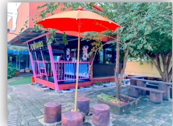
ภาพ การเปิดจำหน่ายสินค้าของร้านค้าคาเฟ่นมสด ในช่วงเวลา ๑๑.๓๐ - ๑๒.๕๐ น.

๒.๓ กิจกรรมบริษัทสร้างการดีโรงผลิตน้ำดื่มโรงเรียนวัดท่าไทร(ดิตถานุเคราะห์) นักเรียน เรียนรู้กระบวนการผลิตน้ำดื่มที่สะอาดและได้มาตรฐาน ผลิตและส่งจำหน่ายภายในโรงเรียนเพียงพอต่อ การบริโภคต่อวัน