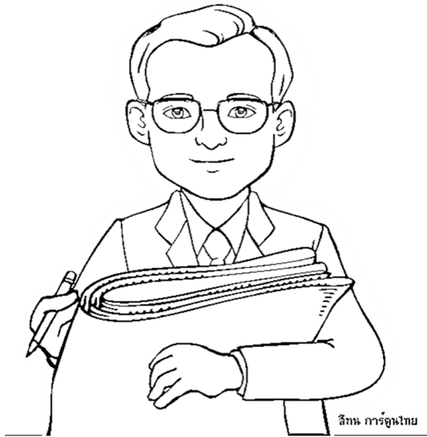
สีแทน การ์ตูนไทย

คำชี้แจง ให้เด็กๆ เขียนตามเส้นประและระบายสีภาพให้สวยงาม