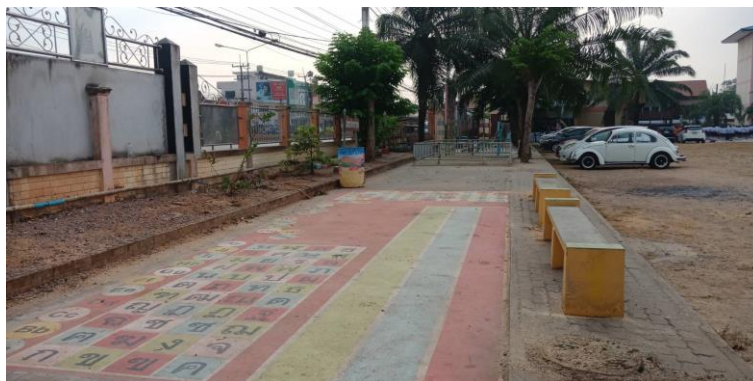
สถานที่สร้างโรงฝึกงานเอนกประสงค์