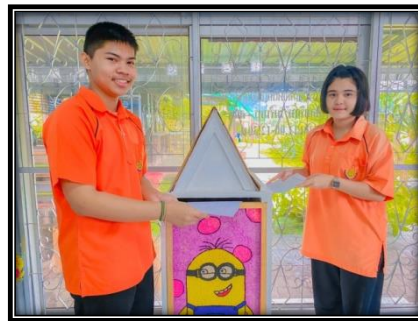
ภาพ ธนาคารกระดาษ และชิ้นงานจากกระดาษ