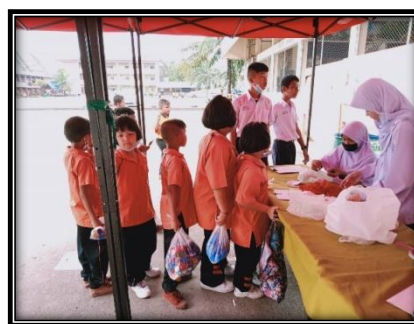
ภาพ ผู้บริหาร ครู และนักเรียนนำขยะมาแลกแต้ม สะสมเพื่อแลกของรางวัล