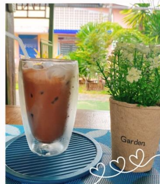
นมสดช็อกโกแลต