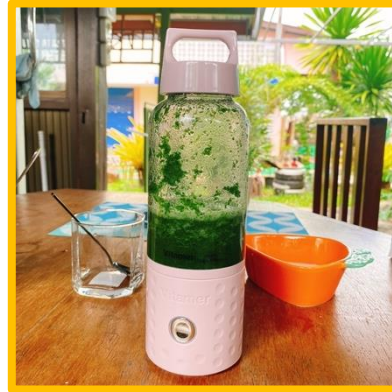
ภาพ การสกัดสีจากดอกอัญชัน และใบเตย