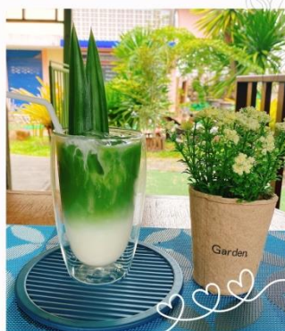
นมสดเตยหอม