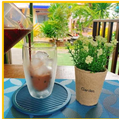
ภาพ การทำเมนูนมสด