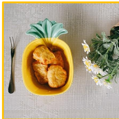
ภาพ การทำเมนูของทานคู่