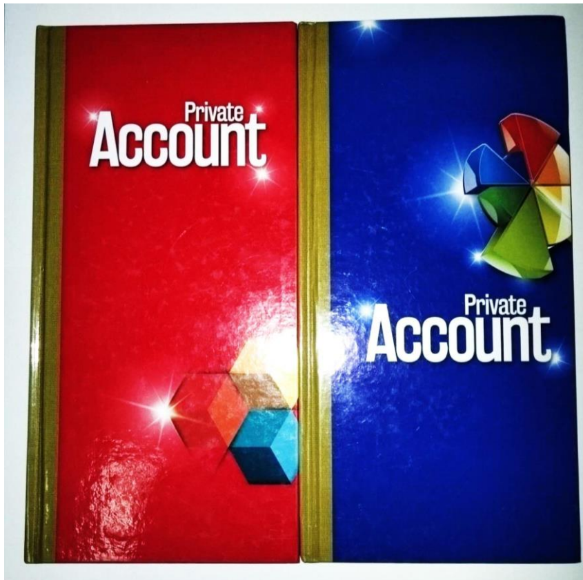
สมุดบัญชีรายรับ - รายจ่าย

ภาพ การบันทึกรายรับรายจ่าย และการนำรายรับฝากออมกับธนาคารโรงเรียนวัดท่าไทร(ดิตถานุเคราะห์)