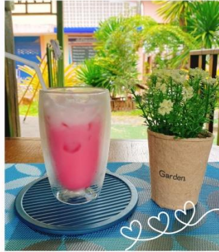
นมสดสตอเบอร์รี่