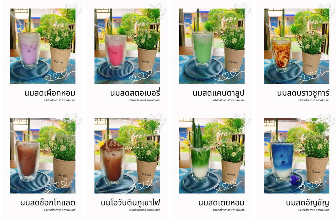
ภาพ เมนูนมสด

จากกระบวนการในการร่วมกันวางแผนในการดำเนินงานข้างต้น ทำให้บริษัทสร้างการดี “คาเฟ่ผสมสด” มีเมนูรายการนมสดและของทานคู่ที่มีรสชาติอร่อย ตรงตามความสนใจของผู้บริโภคทั้งในระดับอนุบาล ประถม และระดับมัธยมศึกษาตอนต้น ในราคาที่ไม่แพง ร้านคาเฟ่ผสมสดกลายเป็นจุดพักผ่อนของนักเรียนในช่วงเวลาพักกลางวัน โดยร้านคาเฟ่ผสมสดมีเมนูวางจำหน่าย ดังนี้