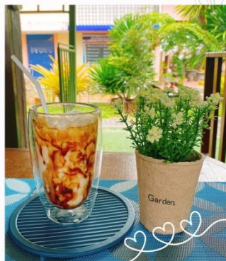
นมสดบราซูการ์