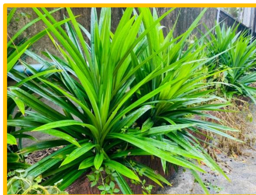
ภาพ การใช้พื้นที่ว่างในโรงเรียนปลูกเตยหอม และดอกอัญชันเพื่อใช้ในการทำเมนูนมสด