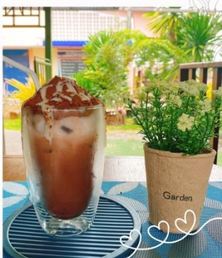
นมไอวันตินกุเขาไฟ