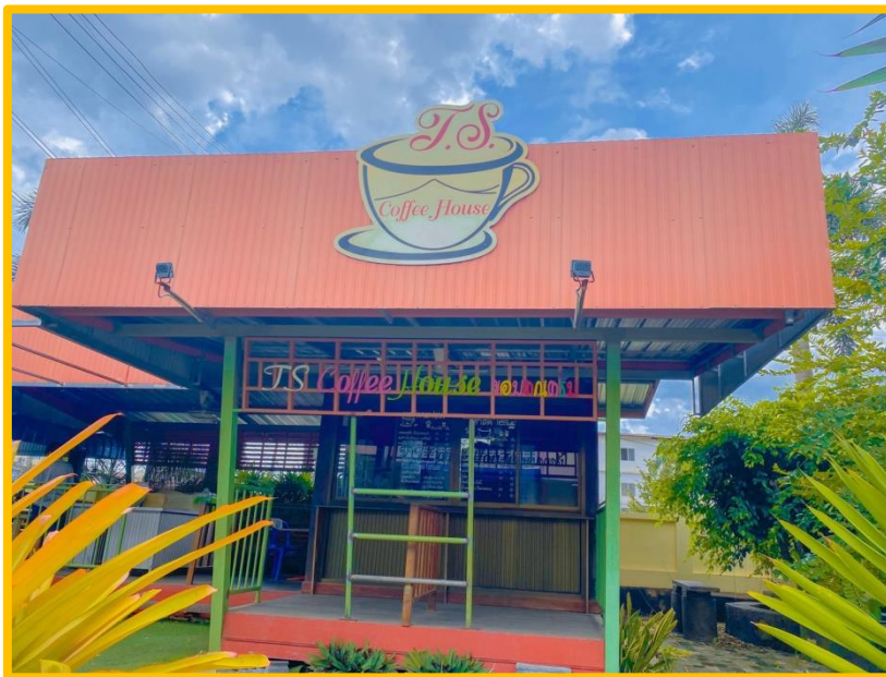
ภาพ ร้านคาเฟ่นมสด

บริษัทสร้างการดี “คาเฟ่นมสด” เปิดจำหน่ายในลักษณะร้านค้า ในช่วงเวลาพักกลางวัน คือ 11.30 น. – 12.30 น. โดยใช้พื้นที่ของร้าน T.S. Coffee มีมุมพักผ่อน โต๊ะเก้าอี้สำหรับรองรับนักเรียนที่มาใช้บริการ บรรยากาศรอบๆ ร้านร่มรื่น สวยงาม