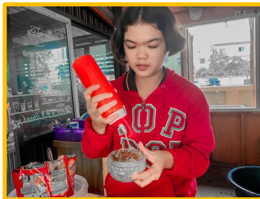
ภาพ กิจกรรมบริษัทสร้างการดี “คาเฟ่นมสด” ร่วมเป็นส่วนหนึ่งในโครงการโรงเรียนปลอดขยะ ใช้ชั้นน้ำสแตนเลสแทนการใช้แก้วพลาสติก