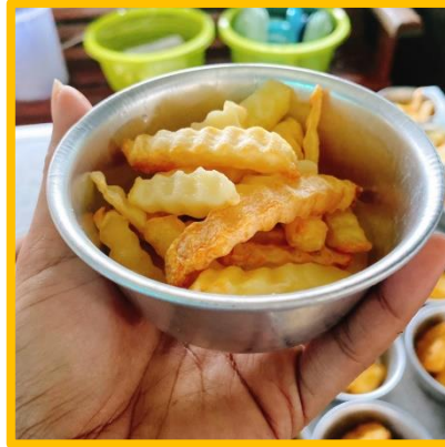
ภาพ กิจกรรมบริษัทสร้างการดี “คาเฟ่นมสด” ร่วมเป็นส่วนหนึ่งในโครงการโรงเรียนปลอดขยะ ใช้ถ้วยอลูมิเนียมแทนการใช้ถ้วยพลาสติกหรือถ้วยโฟม

ผลจากการเข้าร่วมเป็นส่วนหนึ่งของโครงการโรงเรียนปลอดขยะ (Zero Waste School) ทำให้ปริมาณขยะจากร้าน คาเฟ่นมสด ลดลงถึงร้อยละ 95% ต่อ ยังคงเหลือขยะที่มาจากหลอดน้ำดื่มและบรรจุภัณฑ์ของอุปกรณ์ที่ใช้ทำเมนูนมสดและของทานคู่เท่านั้น โดยโรงเรียนได้นำกิจกรรมตามโครงการโรงเรียนปลอดขยะ (Zero Waste School) เข้าร่วมประเมินในปี 2564 ผลการเข้าร่วมประเมินโครงการโรงเรียนปลอดขยะ (Zero Waste School) โรงเรียนวัดท่าไทร(ดิตถานุเคราะห์) ได้รับเกียรติบัตรผ่านเกณฑ์การประเมินในระดับดี นำพาความภาคภูมิใจให้แก่กิจกรรมบริษัทสร้างการดี “คาเฟ่นมสด” ที่ได้เป็นส่วนหนึ่งในความสำเร็จเกิดความภาคภูมิใจในการมุ่งมั่นทำดี และสานต่อกิจกรรมในปีการศึกษาต่อไป