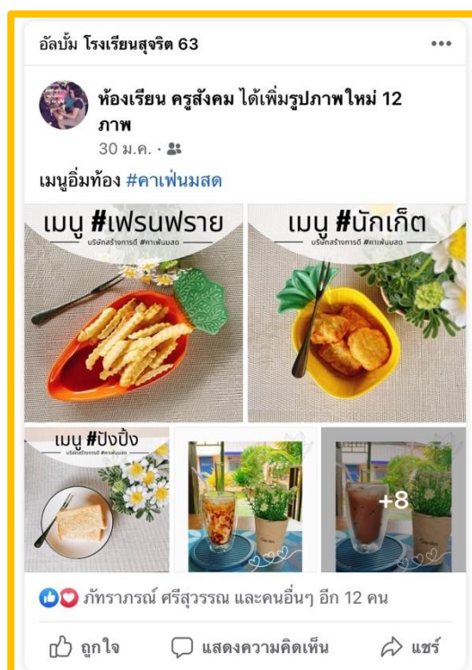
ภาพ การประชาสัมพันธ์การดำเนินกิจกรรมผ่านการสื่อออนไลน์