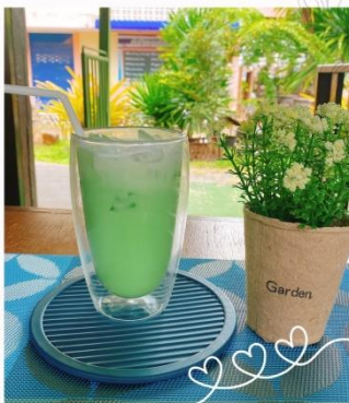
นมสดแคนตาลูป