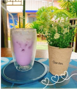
นมสดเพื่อกหอม