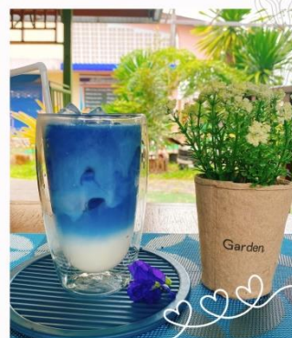
นมสดอัญชัญ