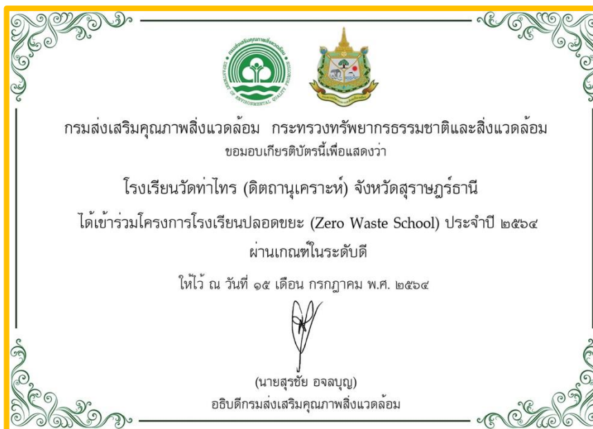
ภาพ เกียรติบัตรโครงการโรงเรียนปลอดขยะ (Zero Waste School) โรงเรียนวัดท่าไทร(ดิตถานุเคราะห์) ผ่านเกณฑ์การประเมินในระดับดี ประจำปี 2564

ผลจากการเข้าร่วมเป็นส่วนหนึ่งของโครงการโรงเรียนปลอดขยะ (Zero Waste School) ทำให้ปริมาณขยะจากร้าน คาเฟ่นมสด ลดลงถึงร้อยละ 95% ต่อ ยังคงเหลือขยะที่มาจากหลอดน้ำดื่มและบรรจุภัณฑ์ของอุปกรณ์ที่ใช้ทำเมนูนมสดและของทานคู่เท่านั้น โดยโรงเรียนได้นำกิจกรรมตามโครงการโรงเรียนปลอดขยะ (Zero Waste School) เข้าร่วมประเมินในปี 2564 ผลการเข้าร่วมประเมินโครงการโรงเรียนปลอดขยะ (Zero Waste School) โรงเรียนวัดท่าไทร(ดิตถานุเคราะห์) ได้รับเกียรติบัตรผ่านเกณฑ์การประเมินในระดับดี นำพาความภาคภูมิใจให้แก่กิจกรรมบริษัทสร้างการดี “คาเฟ่นมสด” ที่ได้เป็นส่วนหนึ่งในความสำเร็จเกิดความภาคภูมิใจในการมุ่งมั่นทำดี และสานต่อกิจกรรมในปีการศึกษาต่อไป