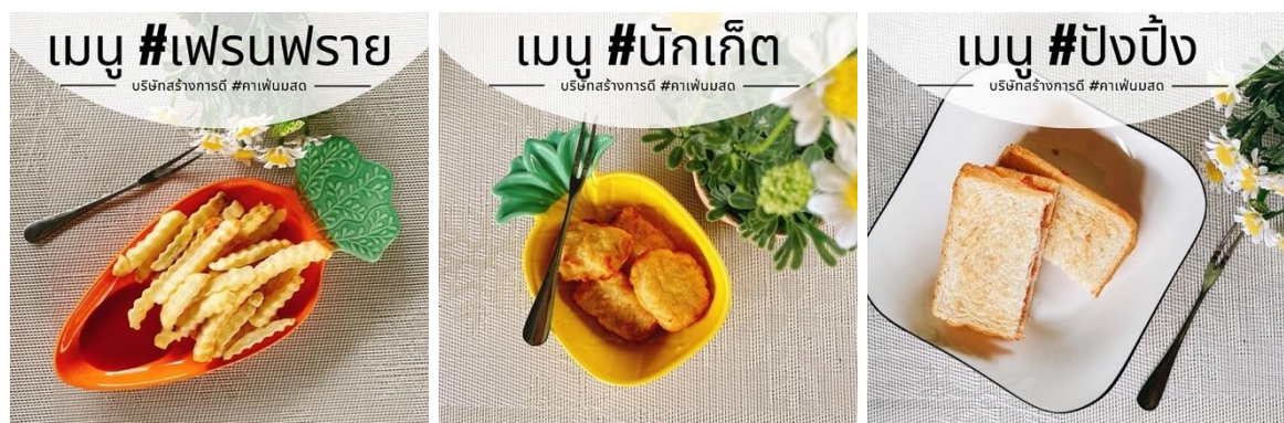
ภาพ เมนูทานคู่