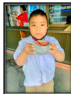
ภาพ กิจกรรมร้านค้า ตลาดนัดเรียนรู้สู่อาชีพ เปลี่ยนการใช้พลาสติกเป็นการใช้ใบตอง ถ้วย และช้อนน้ำ