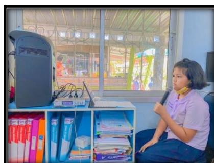
ภาพ การประชาสัมพันธ์กิจกรรมผ่านกิจกรรมหน้าเสาธง และเสียงตามสาย