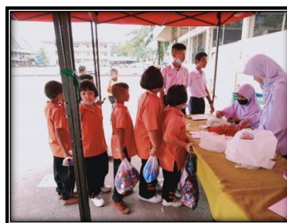
ภาพ ผู้บริหาร ครู และนักเรียนนำขยะมาแลกแต้ม สะสมเพื่อแลกของรางวัล