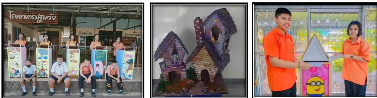
ภาพ ธนาคารกระดาษ และชิ้นงานจากกระดาษ

เงื่อนไขการขับเคลื่อนกิจกรรม คือ การนำกระดาษจากธนาคารกระดาษมาใช้ในการทำกระปุกออมสิน สร้างจุดสนใจให้แก่ นักเรียนในโรงเรียน