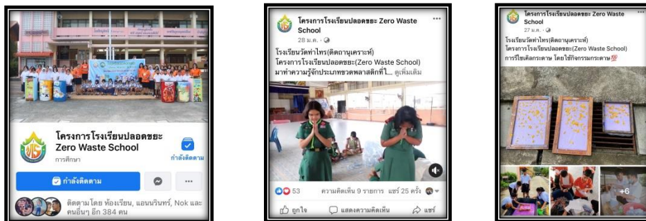
ภาพ การเผยแพร่การดำเนินกิจกรรมผ่านเว็บเพจโรงเรียน

จากการดำเนินงาน “จิตอาสา น้อมนำศาสตร์พระราชาสู่กระบวนการจัดการขยะที่ยั่งยืน” โรงเรียนได้มีการเผยแพร่ภาพกิจกรรมการดำเนินงาน ผลการดำเนินงาน ผ่านทางเว็บเพจของโรงเรียน รวมถึงการเป็นแหล่งเรียนรู้ให้แก่นักเรียน บุคลากรภายในโรงเรียน ผู้ปกครอง และชุมชน