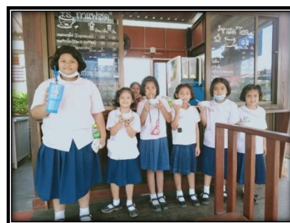
ภาพ การมีส่วนร่วมของนักเรียนในการใช้ถุงผ้า และแก้วน้ำส่วนตัวภายในโรงเรียน