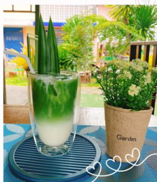
นมสดเตยหอม