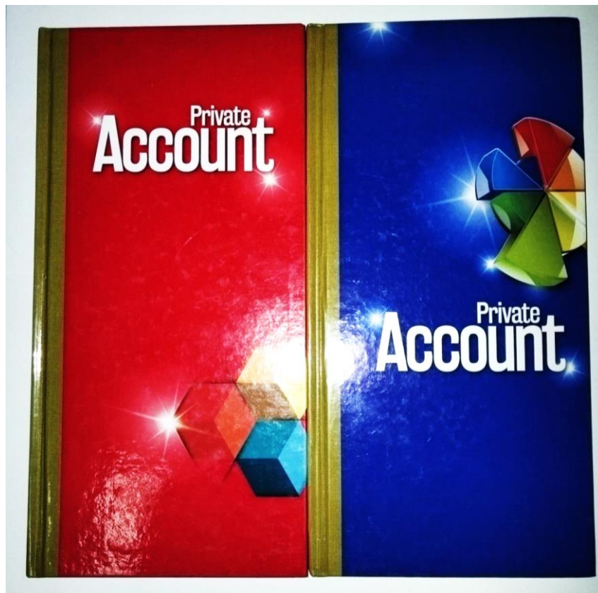
สมุดบัญชีรายรับ - รายจ่าย

ภาพ การบันทึกรายรับรายจ่าย และการนำรายรับฝากออมกับธนาคารโรงเรียนวัดท่าไทร(ดิตถานุเคราะห์)