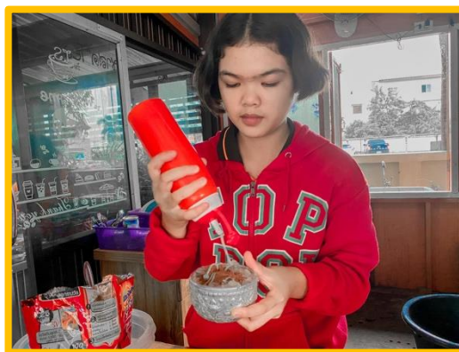
ภาพ กิจกรรมบริษัทสร้างการดี “คาเฟ่นมสด” ร่วมเป็นส่วนหนึ่งในโครงการโรงเรียนปลอดขยะ ใช้ชั้นน้ำสแตนเลสแทนการใช้แก้วพลาสติก