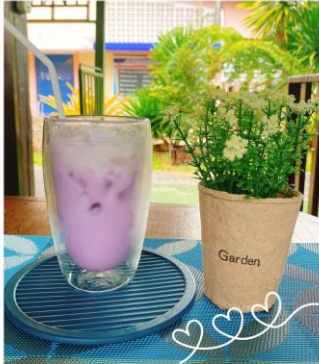
นมสดเพื่อกหอม