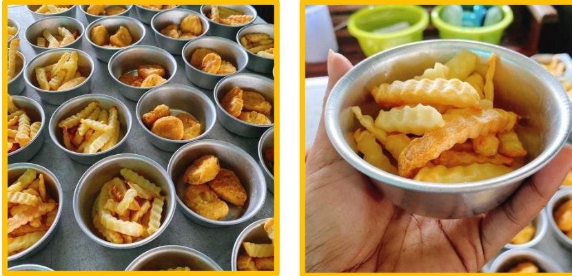
ภาพ กิจกรรมบริษัทสร้างการดี “คาเฟ่นมสด” ร่วมเป็นส่วนหนึ่งในโครงการโรงเรียนปลอดขยะ ใช้ถ้วยอลูมิเนียมแทนการใช้ถ้วยพลาสติกหรือถ้วยโฟม

ผลจากการเข้าร่วมเป็นส่วนหนึ่งของโครงการโรงเรียนปลอดขยะ (Zero Waste School) ทำให้ปริมาณขยะจากร้าน คาเฟ่นมสด ลดลงถึงร้อยละ 95% ต่อ ยังคงเหลือขยะที่มาจากหลอดน้ำดื่มและบรรจุภัณฑ์ของอุปกรณ์ที่ใช้ทำเมนูนมสดและของทานคู่เท่านั้น โดยโรงเรียนได้นำกิจกรรมตามโครงการโรงเรียนปลอดขยะ (Zero Waste School) เข้าร่วมประเมินในปี 2564 ผลการเข้าร่วมประเมินโครงการโรงเรียนปลอดขยะ (Zero Waste School) โรงเรียนวัดท่าไทร(ดิตถานุเคราะห์) ได้รับเกียรติบัตรผ่านเกณฑ์การประเมินในระดับดี นำพาความภาคภูมิใจให้แก่กิจกรรมบริษัทสร้างการดี “คาเฟ่นมสด” ที่ได้เป็นส่วนหนึ่งในความสำเร็จเกิดความภาคภูมิใจในการมุ่งมั่นทำดี และสานต่อกิจกรรมในปีการศึกษาต่อไป