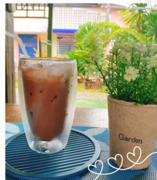
นมสดช็อกโกแลต