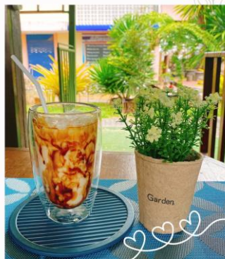
นมสดบราวนชูการ์