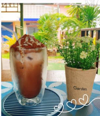
นมไอวันตินกุเขาไฟ