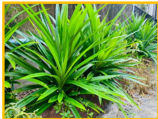
ภาพ การใช้พื้นที่ว่างในโรงเรียนปลูกเตยหอม และดอกอัญชันเพื่อใช้ในการทำเมนูนมสด