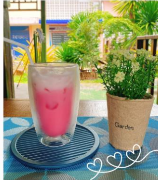
นมสดสตอเบอรี่