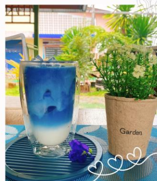
นมสดอัญชัญ