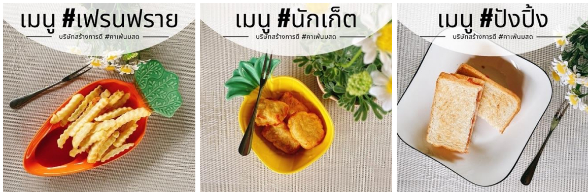
ภาพ เมนูทานคู่