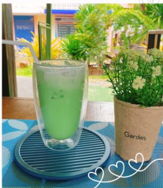
นมสดแคนตาลูป