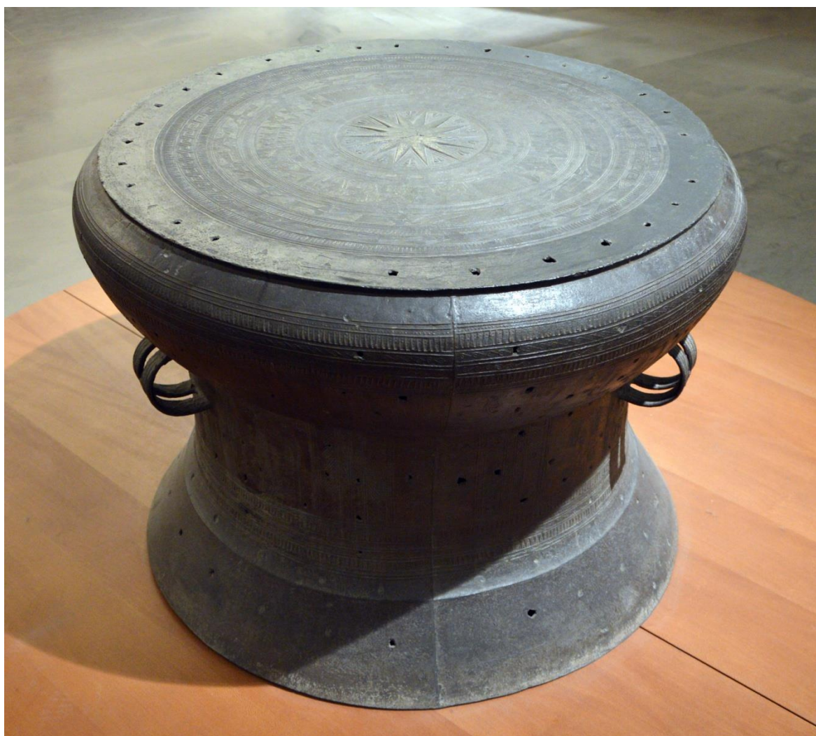
ภาพหลักฐานทางประวัติศาสตร์ “กลองมโหระทึก ยุคสำริด”