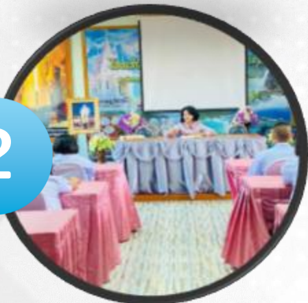
กิจกรรมอบรมแกนนำผู้ก่อการดี