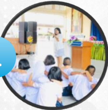
กิจกรรมค่ายยุวชนคนคุณธรรม