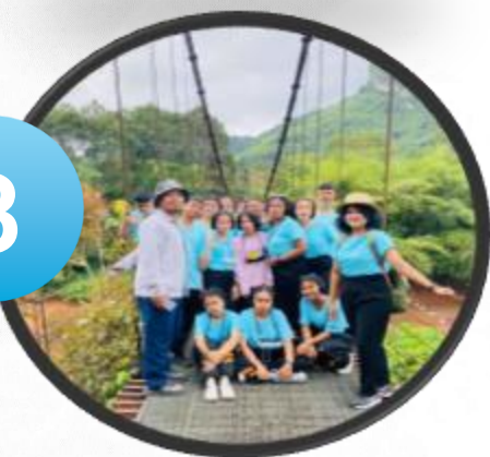
กิจกรรมทัศนศึกษาแหล่งเรียนรู้