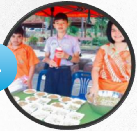
กิจกรรมบริษัทสร้างการดี