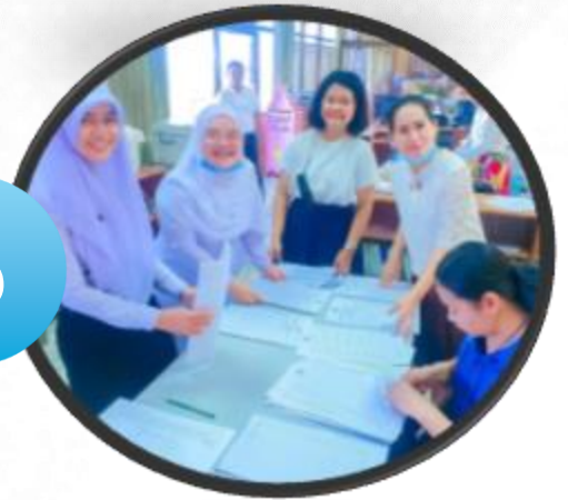
กิจกรรมสอบธรรมศึกษา