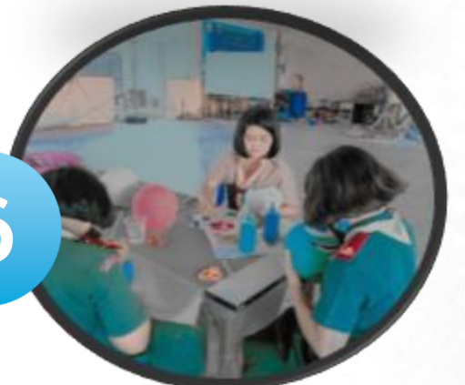
กิจกรรมพี่สอนน้องเรียนรู้ เล่นผ่านวิถีพอเพียง