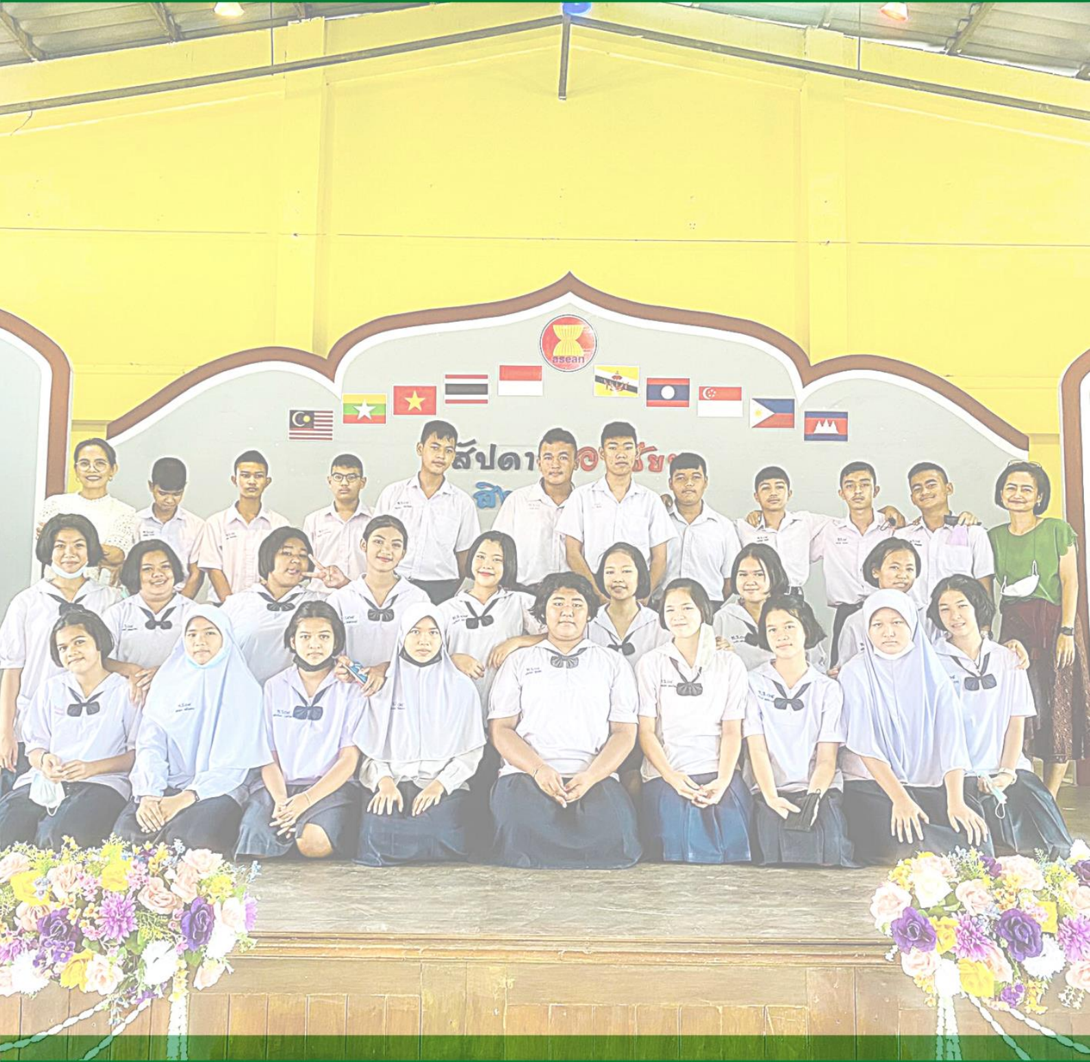
โรงเรียนวัดท่าโพธิ์(ดิตถานุเคราะห์) สำนักงานเขตพื้นที่การศึกษาประถมศึกษาสุราษฎร์ธานี เขต 1