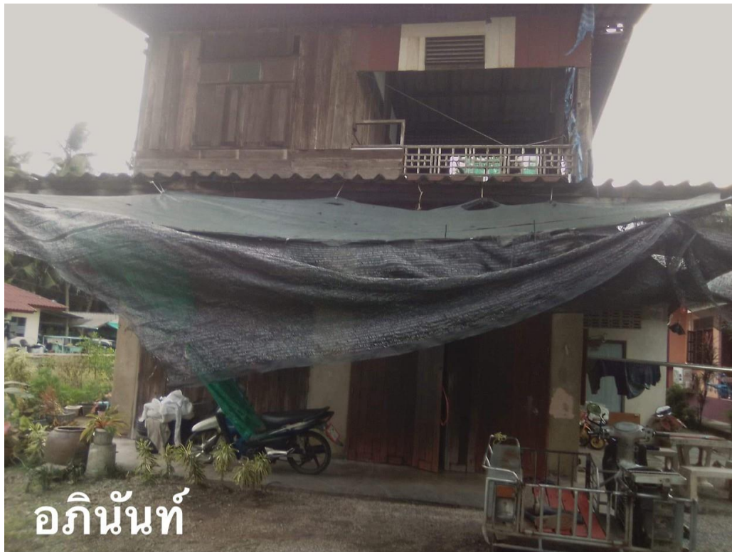
อภินันท์