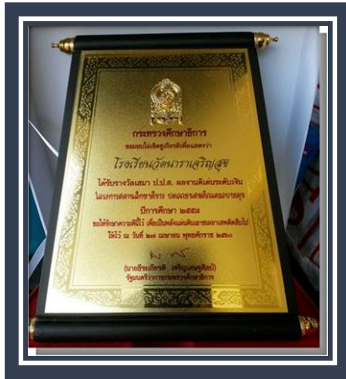
เอกสารประกอบการได้รางวัล โรงเรียนวัดกุฎีเขาทอง