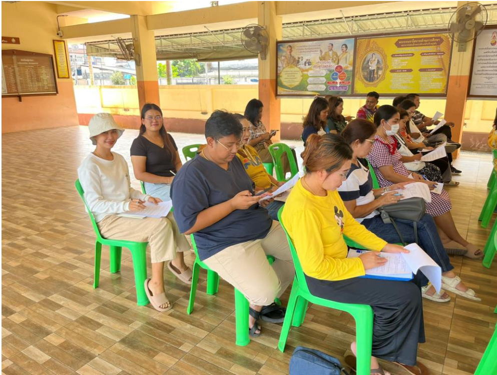
ข้าพเจ้ามีการแลกเปลี่ยนเรียนรู้กันระหว่างเพื่อนร่วมวิชาชีพทั้งในโรงเรียนเดียวกันและต่างโรงเรียน