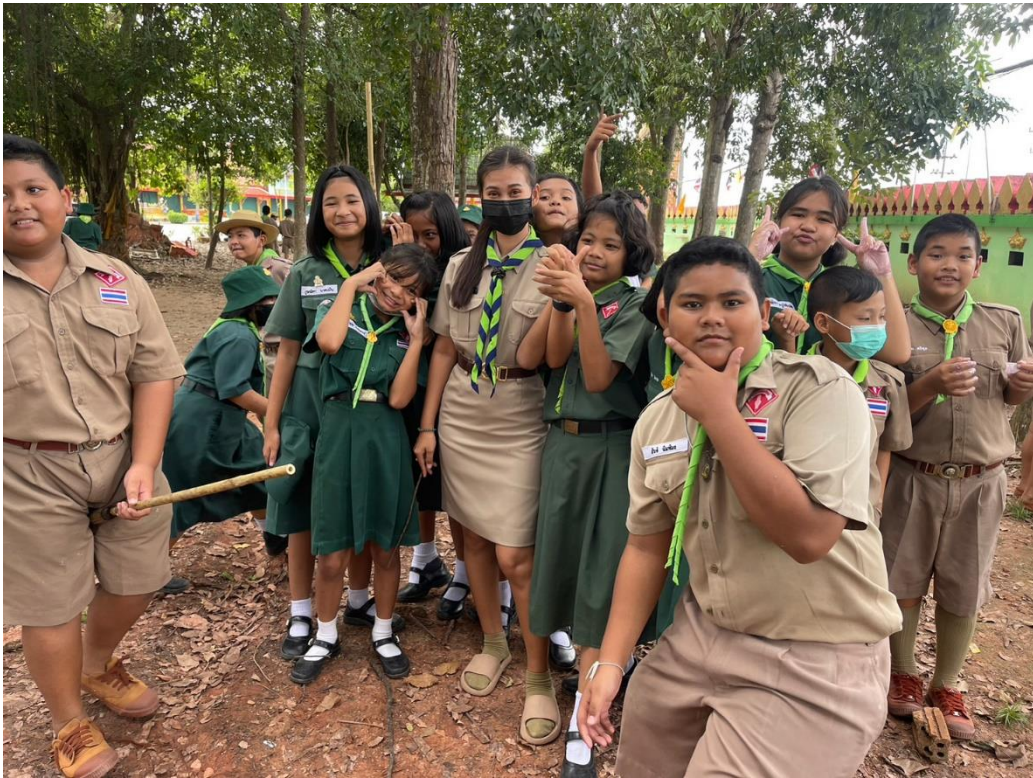
ข้าพเจ้าเข้าร่วมกิจกรรมส่งเสริมจิตสาธารณะ มีความรับผิดชอบต่อสังคมและส่งเสริม ปลูกฝังให้ผู้เรียน มีจิตสาธารณะ